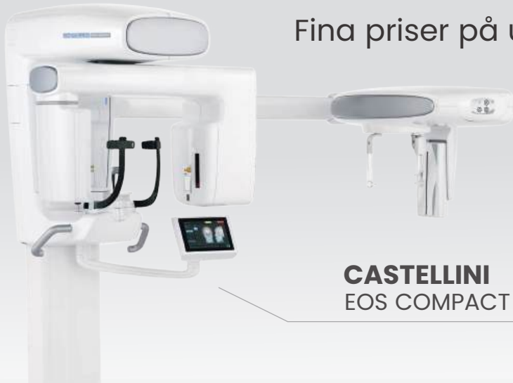
CASTELLINI EOS COMPACT 2D

Fina priser på utvalda produkter från BiCef